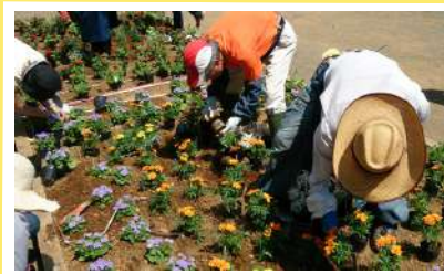
植える人も、お手入れする人も 見る人もみんなが笑顔になります