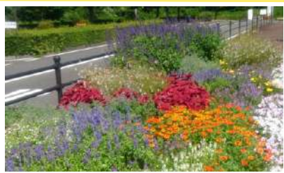
花選び・土づくり わが家の花壇づくりからはじめます