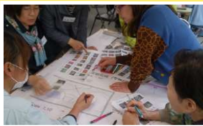
同じような想いをを持った花人と一緒に学びます