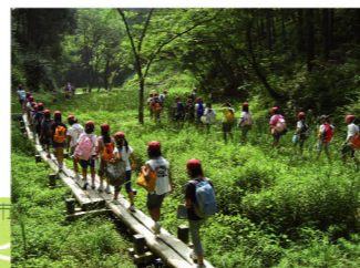
「榛原ふるさとの森」の状況