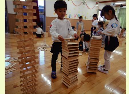
間伐材の積み木で木育(浜松市)