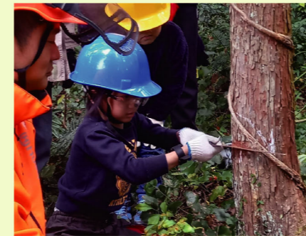
子どもたちが間伐に挑戦