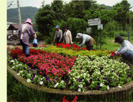
かわづ花の会による花壇整備