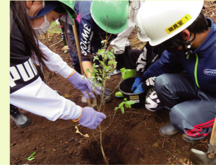
子どもたちが希望を託して植樹