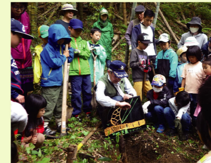
興津川保全市民会議によるタケノコ掘り