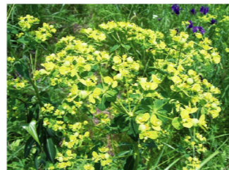
フジタイゲキ 県RDB絶滅危惧IB類