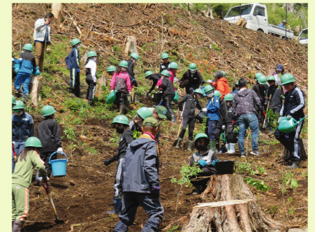
北郷緑の少年団による植樹