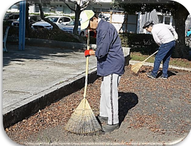
砂場にも落ち葉が積り！