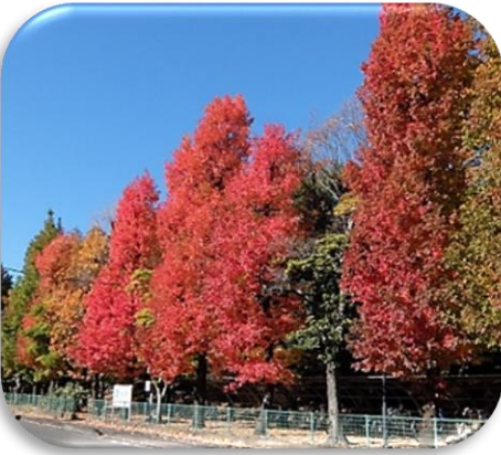
景観も木陰も大事です よい環境を残したい

街路・公園の木は鑑賞を目的とする庭園の木とは意味が異なる。人の生活の場に植えられている木は、夏は木陰が大きな意味を持つだろう。人が屋外で過ごす目的はさまざま。通学はいやでも外歩きになる。犬ねこなど動物も人と共生している。彼らの生活もこれまでどおりでなければならぬ。そのために街路、公園の木陰の役割は大きくなる。木の管理はその目的に沿って行うことが必要になる。目的は人の健康を護ること。「見た目によければよい」という管理は見直さなければならぬ。街路樹は、木陰が多いのがよい。人は、地球を沸騰させた一人として、過ごしやすい環境を次の世代へ残すことを考えなければならぬ