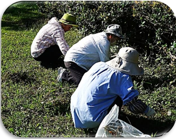
猛暑が続き、雑草がいっぱい！

十月十三日(日)連休中でしたが、好天にも恵まれ十七名の会員参加により公園整備を行いました。今回は椿の垣根前にある花壇を整備してフクロナデシコの種を播き、先日来の大雨で泥が溜まった溜枿の清掃、公園内外の落ち葉収集、円形花壇の雑草取りなどの作業を行いました。ようやく猛暑は収まりましたが、今日も夏田となりましたので作業を早めに終了し青空の下、お茶とお菓子を食べながら楽しい話に花を咲かせて解散となりました。