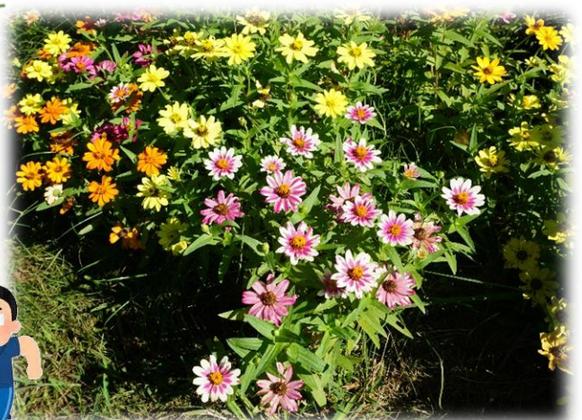
ようやく訪れた秋を迎えて！