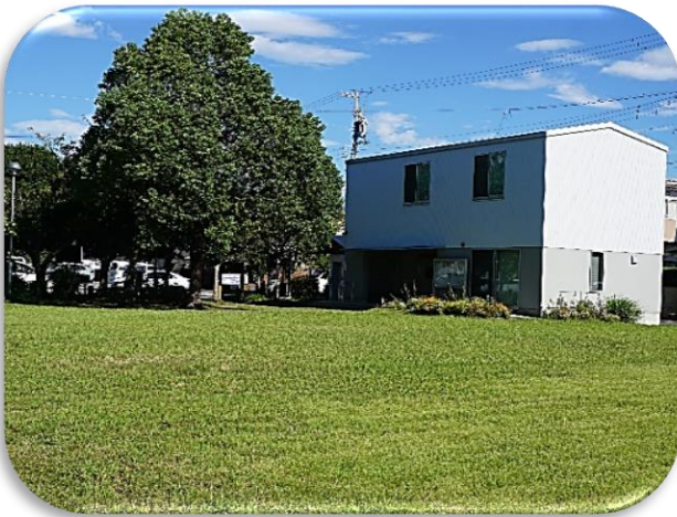
芝もきれいに刈れました！