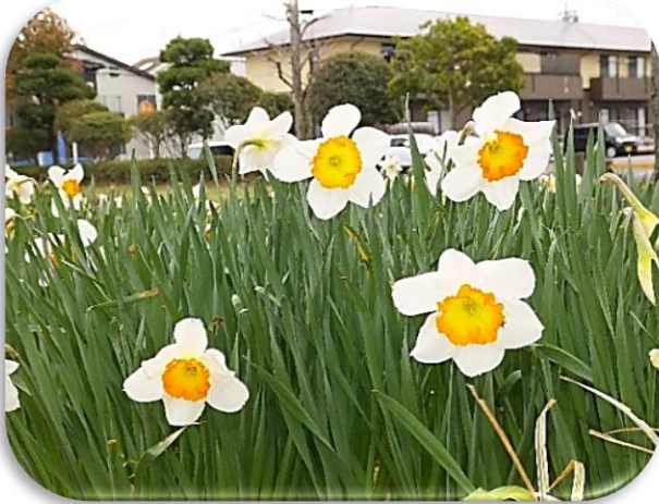
遅咲きのスイセンが開花！