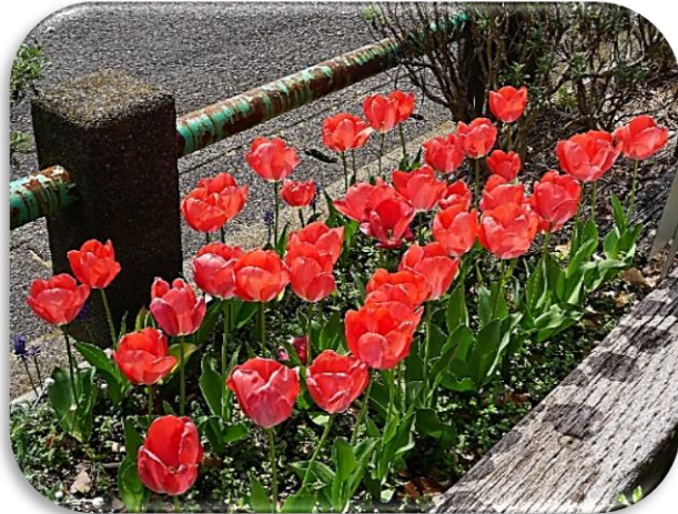
チューリップ満開！