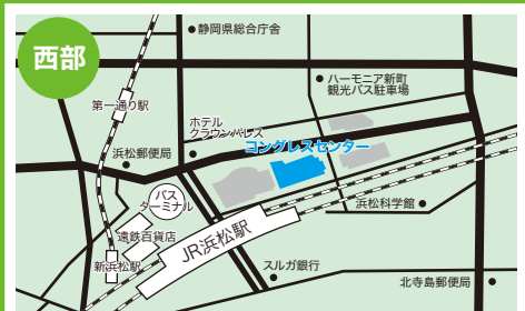
アクトシティ浜松コンgresセンター52~53会議室

沼津市大手町1-1-4 TEL:055-920-4100 □JR沼津駅北口より徒歩3分