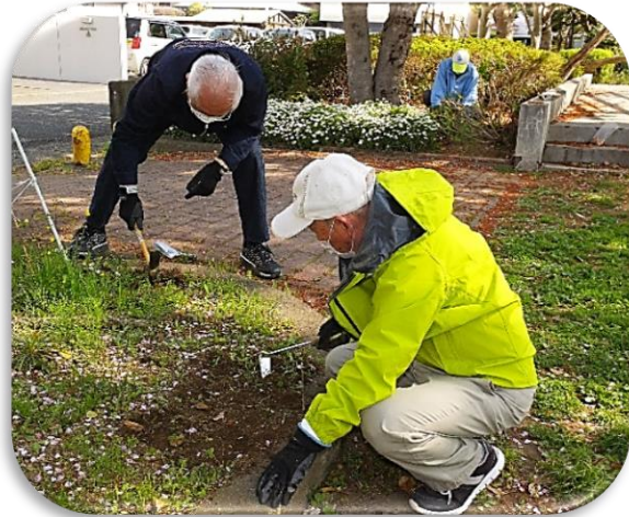
歳を忘れて球根の植え付け!