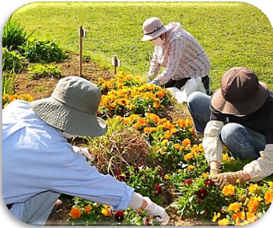
パンジーに囲まれて!

四月二日(日) 暖かい朝を迎え、桜が満開となる中で会員十八名の参加を得て定期整備を行いました。今回は県グリーンバンクより配付をいただいたグラジオラス、ゼフィランサス、リアトリスなどの球根を五ヶ所の花壇への植付けやパンジー・ビオラの花殻摘み、春の訪れで花壇一面に伸び始めた雑草の除去などの作業を行いました。会員の高齢化が更に進む中で長時間の作業はできませんが、おしゃべりをしながら楽しい活動ができるよう心掛けたいと思う今日この頃です。