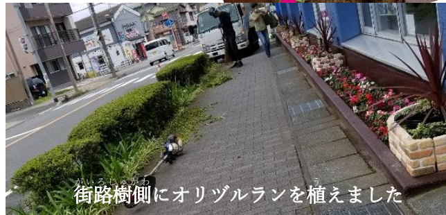
街路樹側にオリヅルランを植えました