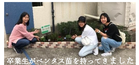
卒業生がペンタス苗を持って来ました