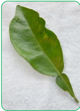
橙や夏ミカンの葉を光に透かすと星のような油点が見える!

こどものころ、春から夏に食べたみかんといえば夏ミカン。近ごろは酸味のあるものは口にしないので若い人は食べた経験がないかもしれない。包丁で切れ目を入れて厚い皮をむくのは面倒なので大人もたべなくなったのかもしれない。花は初夏に咲くがその年には熟さず、翌年の春から夏にかけて食べごろになる。改良種の甘夏は、無人販売で見かける。八朔(はっさく)も似ているが、八朔の親は夏ミカンではない。橙(だいたい)は夏ミカンの親類である。橙酢(だいたいず)は橙の実を絞った料理酢。こどものころ、なんでも自家製だったので、そういう使い方があることだけは知っていたが、最近テレビで一流料理人が橙酢を使うのを見て懐かしかった。橙、夏ミカンの葉は、写真のように大きな葉と小さな葉が重なっているように見えるが、二つ合わせて一つの葉。