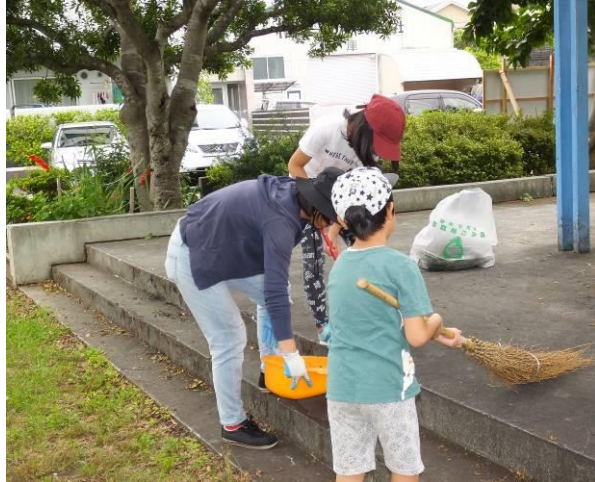
ほうきが重くて大変!