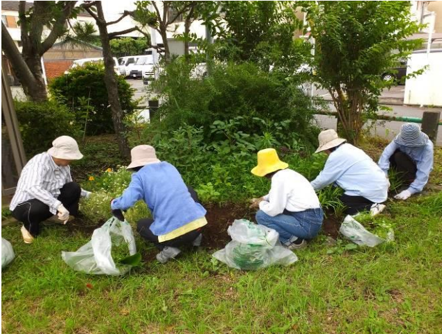
雑草がこんなに伸びて!