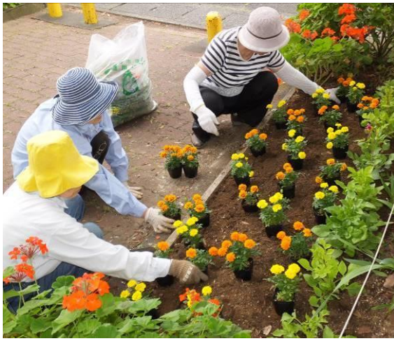
配色に工夫をしながら!

六月二十三日(日)市より配布を頂いたマリーゴールド、コリウス、ベゴニア、種から育てたニチニチソウ、センニチコウなどの花苗植栽作業を行いました。今回の花苗は数が多く六ヶ所の花壇に手分けをし、植付けデザインのアイデアを出しながらで、いっぴくなく大変な作業となりましたが、このところ寂しくなった花壇に綺麗な花が蘇り、植栽後の雨にも助けられ、ポットから移植した時には下を向いていた苗も元気に背を延ばし始めましたので是非公園にお出掛け下さい。