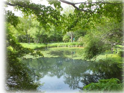
箱根湿生花園 湿生林の植物