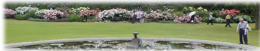
クレマチスの丘 噴水と芝生と ローズガーデン

凛としたタチアオイ、四季の花々の丘と彫刻作品、自然豊かな湿生花園、いろいろな植物と景色を楽しむことができました。とても優しい気持ちになりリフレッシュできました。「花っていいな〜」