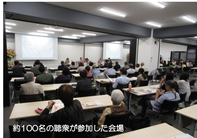
約100名の聴衆が参加した会場

ら始めること。更に既成概念に捉われない、藤枝ならではのスタイルを工夫したら如何でしょう」とご指導いただきました。