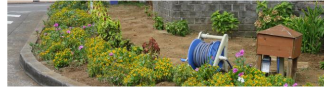
すっかり雑草が除去された北口のロータリー内