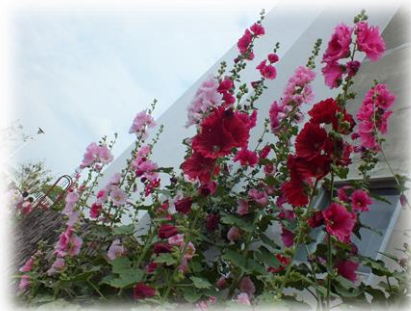
静岡市城北浄化センター タチアオイ（静岡市花）

会員の皆様に広く声を掛け実施している「親睦視察研修旅行」が5月29日に行われました。天候にも恵まれ、バス2台に分乗した72名は、会員相互の親睦を深めながら初夏の1日を満喫しました。