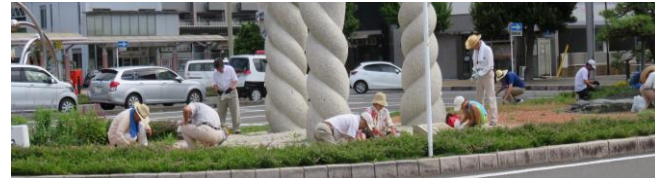
南口モニュメントロータリー内の草取り風景

お盆で帰省される多くの駅利用者を「キレイな花で迎えたい」との合言葉で始まった花の会と地元自治会の協働作業は、県内各地の花の会で関心を持たれ、評価されています。