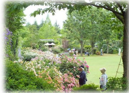
クレマチスの丘 ローズガーデン