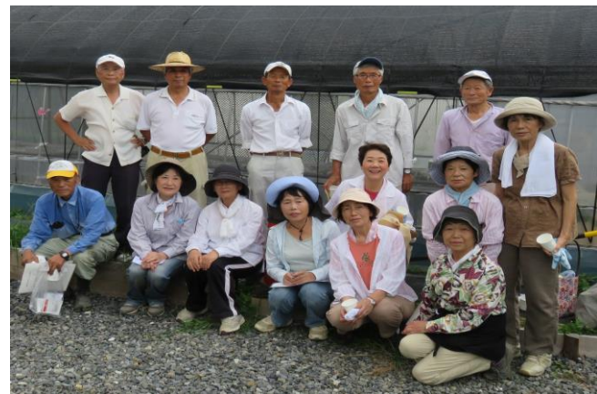
種まきに参加した役員の皆さん（8月2日）

現在8月2日に種まきを実施した葉ボタンとキンセンカ（11月末には植栽可能）を育成中です。