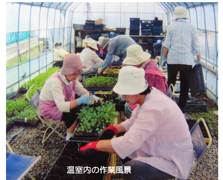
温室内の作業風景