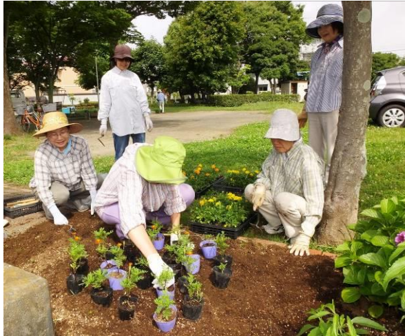
女性会員集合でデザイン検討!