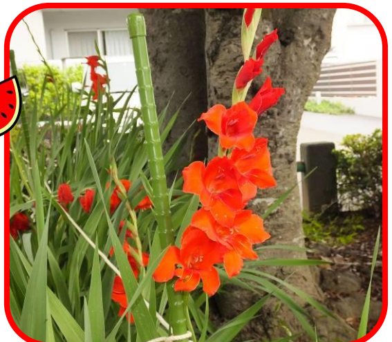
今年の開花は早い!