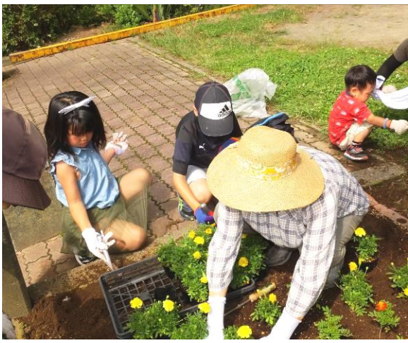
大きく育つといいね!

七月一日(日)今朝も、うだるような暑さとなりましたが多くの会員、子供達の参加を得て整備を行いました。先日より配布された、コリウス、ベゴニア、マリーゴールドやグリーンバンクから支給の種から育てたサルビアなど約五百株を、前回土壌改良を施した多くの花壇に植付けました。子供達も積極的に作業に参加し「これから苗の成長を見守ってね」の声掛けに「分かった」と大きくうなずき、大量の植付けですがに疲れましたが、この返事に救われる思いがしました。