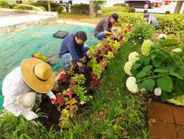
炎天下で大汗をかきながら!