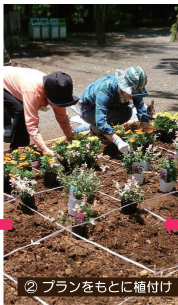
② プランをもとに植付け