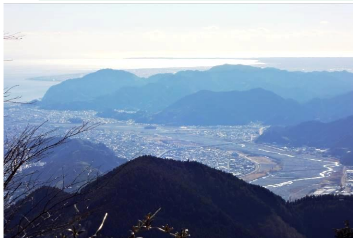
文珠岳からの安倍川と駿河湾の遠望!

清水港から目を西に転じると、竜爪等の山並みの西側直下を安倍川が駿河湾まで一気に流れ込む雄大な景色が見られ、大崩海岸を形成する雄大な山塊のその先には、焼津あたりになるのか、平坦な海岸線が東の方向に一度突出した後、西側に弧を描いた形で湾曲し、再び東方へ突出した辺りで陸地が尽きている。この陸地が尽きたところが御前崎であることは間違いないと思われる。写真は今年の一月であるが白く輝く海が印象にのこっている。