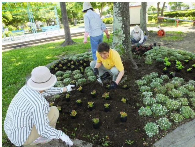
腰痛は大丈夫ですか!

六月八日(日) 市より配布されたポーチュラカ、コリウス、宿根草などを花壇に植え付け作業及び先週に引き続き、育苗ポットへの移植作業を行いました。前回子供達が移植した苗は既に大きく伸び始め、夏の花壇を花いっぱいにする事が出来そうです。子供達も自分で作った苗を大切に育ててくれるであろうし、公園整備を体験し、葉子袋の放棄なども徐々に少なくなるのではないかと期待しています。