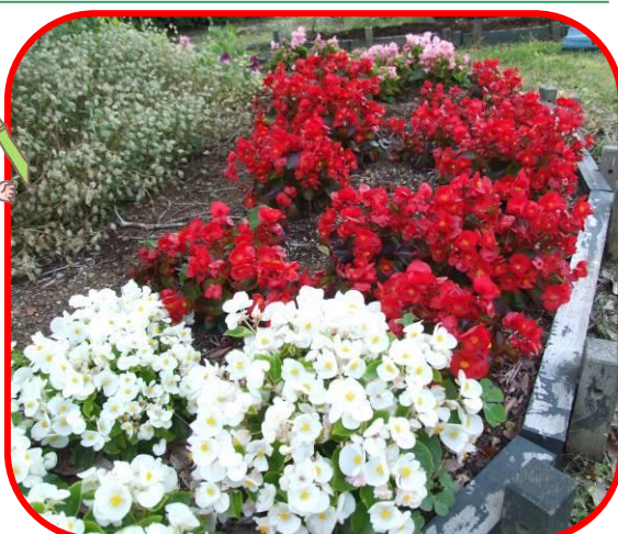
ペゴニアが息を吹き返し!