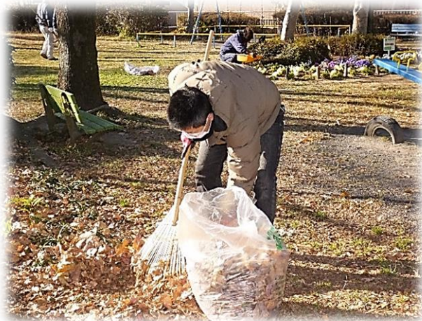
落ち葉の量に驚きました!