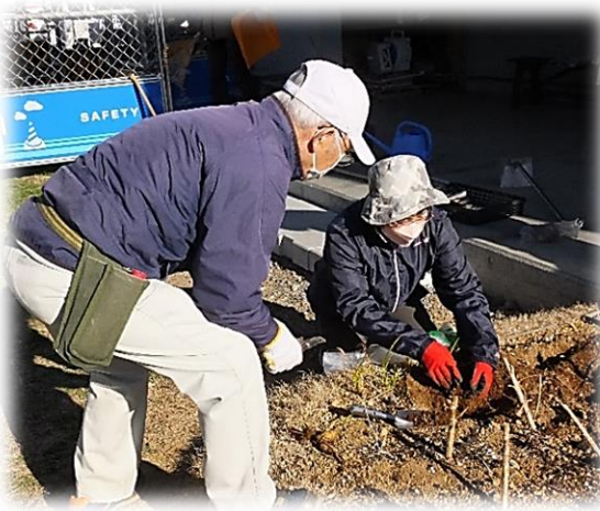
細心の注意で球根を掘り起こしてね!

二月六日(日) 冷たい風が肌にしみる朝、会員、自治会役員併せて十七名の参加により公園整備を実施しました。今回も強風で花壇いっぱい積もった枯葉の収集、昨年花が終わったダリアの球根の掘り起こし、ハナミズキの追加植え付け、溜枮の清掃、花壇への灌水などを行いました。このところオミクロン株によるこれまでにない規模の感染拡大が続き、休憩などの集合を避け短時間で作業を終えましたが、今後も感染の状況を考慮しながら活動を続けたいと思います。