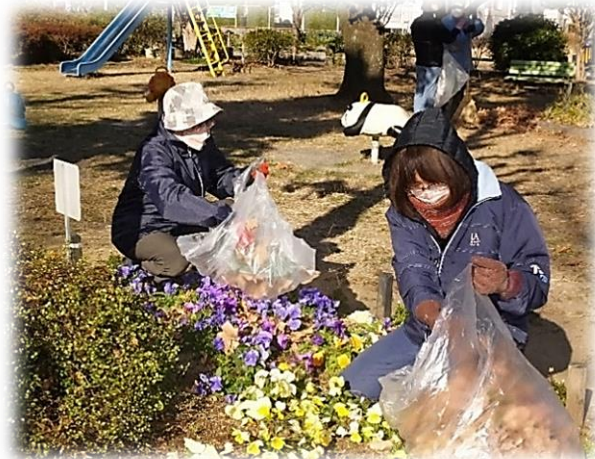
今朝は本当に寒いです!