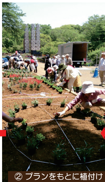
② プランをもとに植付け