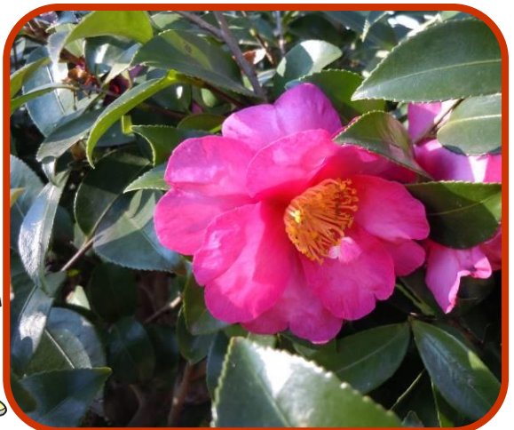
今年も綺麗に咲きました!