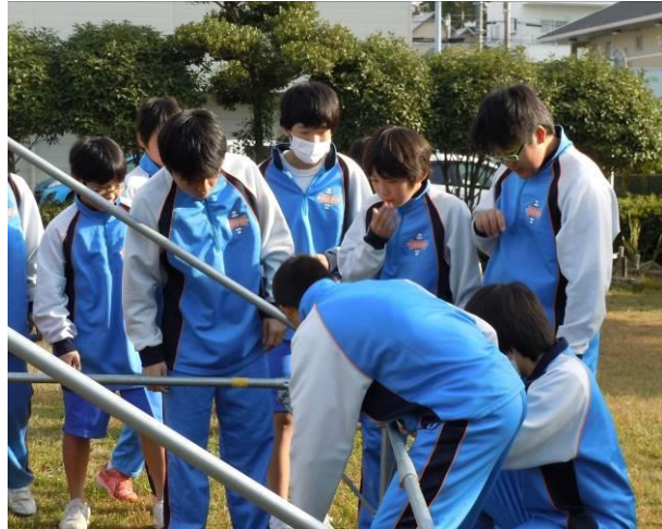
テントの組み立ては初めて!