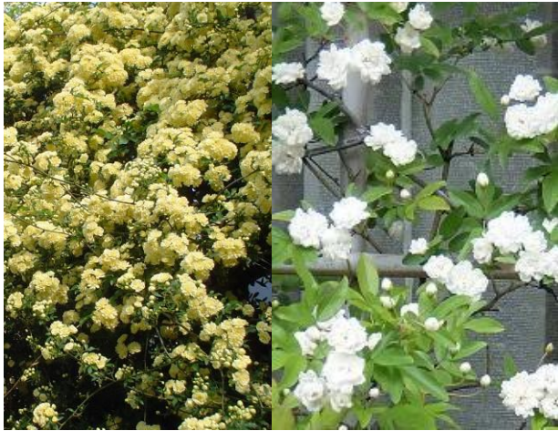
二種のモッコウバラ!

このバラは、花がないときでも常緑の葉は優しい感じがするので窓の装飾や目隠しになり、スタレイバラという別名もあります。トゲがないので防犯には役立たないかもしれません。挿し木で殖やせます。