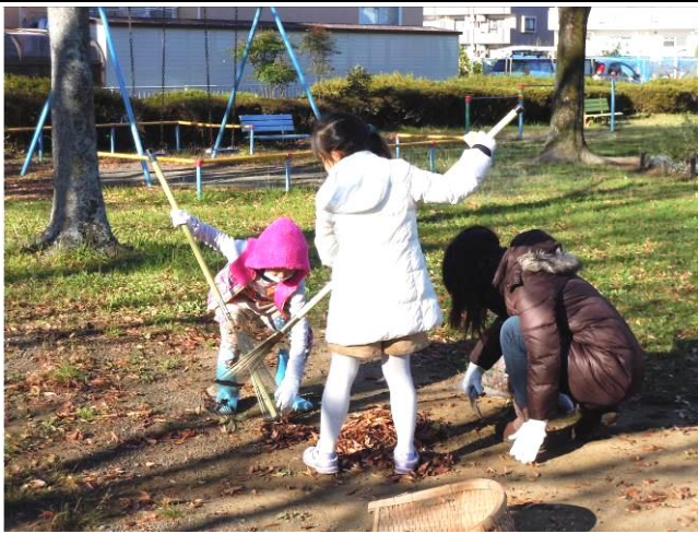
初冬なのに汗をかきながらの作業!

十二月十一日(日) 好天に恵まれ、二十二名の参加により今年最後の整備を行いました。冬到来で公園全体に降り積もった落ち葉の収集作業、枯れた草花の整理、これからやってくる寒い冬を花苗が無事に越せるよう培養土を追加し、肥料の散布なども行いました。今月は市の伐採作業もあり、また日当たりの良い花壇が戻ってきました。先日植えたノースポール、パンジーなども元気に花を咲かせていますのでぜひ公園にお出掛け下さい。