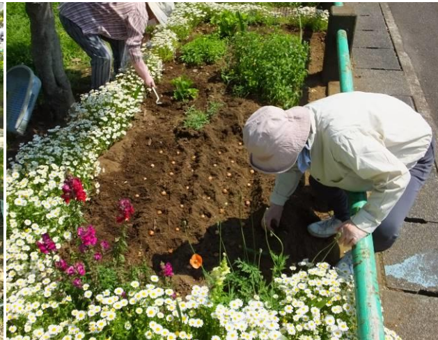
球根植え付けは腰に・・・!