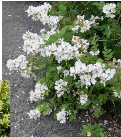
ノイバラ! ♪ わらべは見たり・・・♪