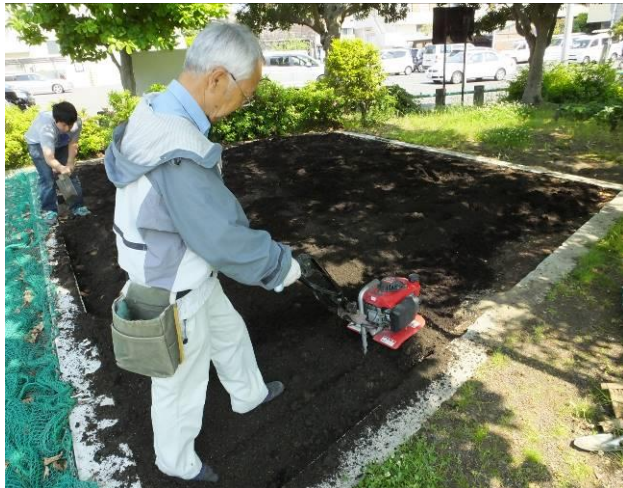
新しい花壇の構想を練りながら!