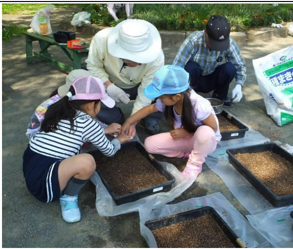
種まき作業に挑戦!

五月一日(日)ゴールデンウィークの初日でしたが、久々に子供達の参加もあり二十一名で整備を行いました。今回はサルビア、センニチコウの種まき、グラジオラス球根の植付け、砂場横に造成された新花壇の耕うん、腐葉土混ぜなど多くの作業を行いました。子供達は会員の指導で結構難しい種まき作業を体験、また雑草取りなども長時間飽きることなく最後まで頑張る姿を見て、これから公園の草花を大切にしてくれる子供達に成長するであろこと期待を膨らませました。